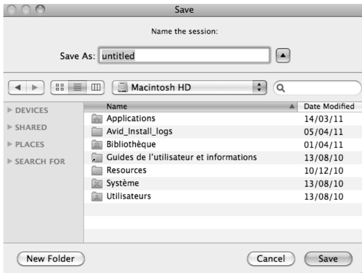
Figure 2.2 : Renseignez l'emplacement et le nom de votre session.

Une fois ces paramètres déterminés, cliquez sur OK, choisissez le nom de votre session et son emplacement dans votre système et appuyez sur Save (voir Figure 2.2).