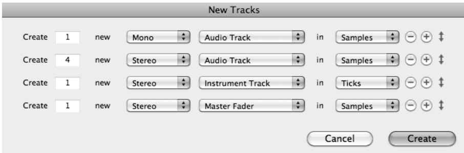
Figure 2.4 : Boîte de dialogue New Tracks avec des pistes de différentes caractéristiques.